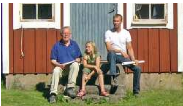
Holmtorp 2002 och på Holmtorps trappa 2009