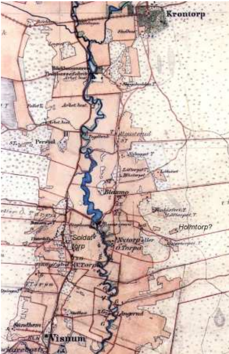
Karta över Krontorp, Bäckhammar, byn Torpa m m vid ån Visnan. Häradsekonomiska kartan ca 1885. "Holmtorp" och "Soldattorp" har lagts till.