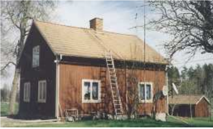
Jakobsdal, f d Hållunda soldattorp 2002.