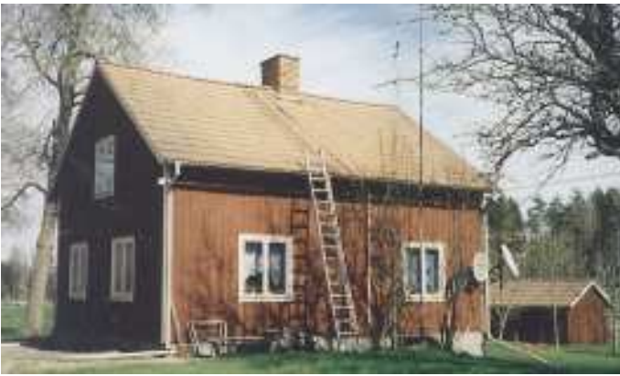
Jakobsdal, f d Hållunda soldattorp 2002.