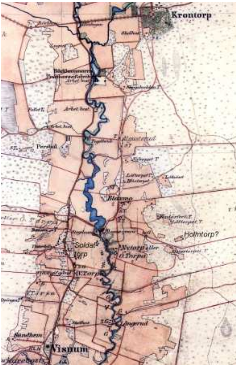
Karta över Krontorp, Bäckhammar, byn Torpa m m vid ån Visnan. Häradsekonomiska kartan ca 1885. "Holmtorp" och "Soldattorp" har lagts till.