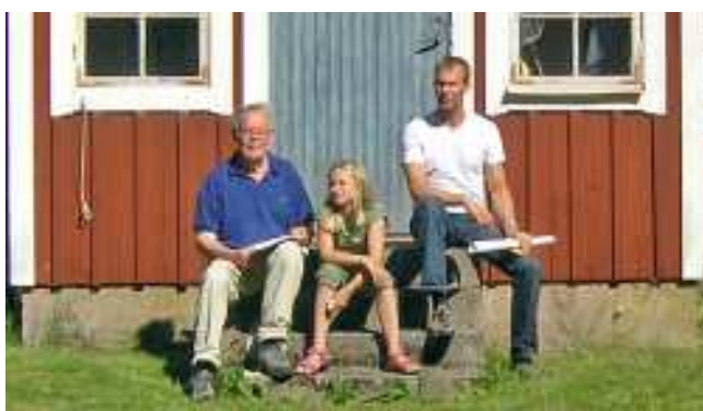
Holmtorp 2002 och på Holmtorps trappa 2009