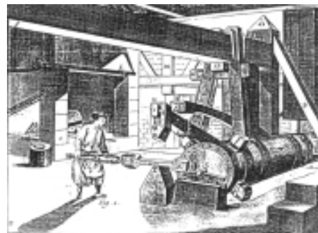
Stångjärnshammare enligt 1700-tal, med en masugn i bakgrunden. (Efter en teckning från 1700-talet.)

Slutprodukten var oftast stångjärn. En del järn bearbetades vidare till olika produkter, t ex spik.